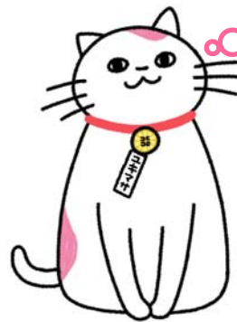
日本行政書士会連合会公式キャラクター ユキマサくん