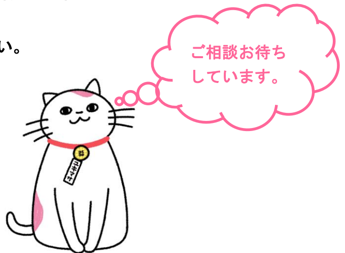
日本行政書士会連合会公式キャラクター ユキマサくん