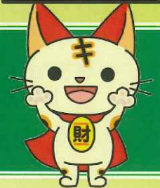
近畿財務局マスコットキャラクター "Kinki CATs"